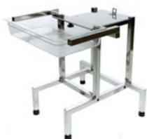
Mesa soporte Máquina