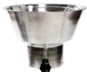
Cilindro alimentador automático