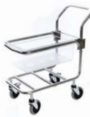
Carro de recogida